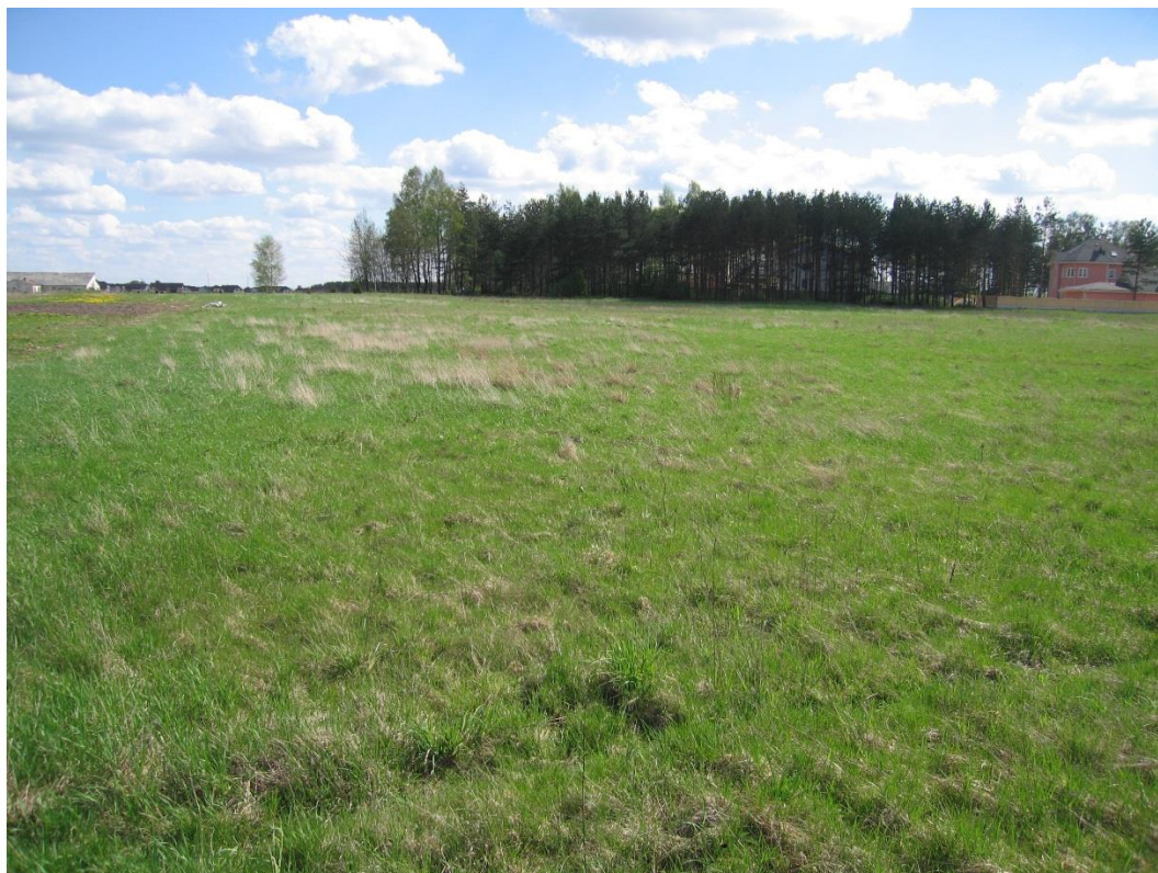
3. attēls. Skats uz detālplānojuma teritoriju no detālplānojuma īpašuma “Adiņas 2”

Detālplānojuma teritorija atrodas Ķekavas novada, Ķekavas pagasta Rāmavas ciemā, bez tiešas piekļuves no Ķekavas novada pašvaldības īpašumā esošas ielas.