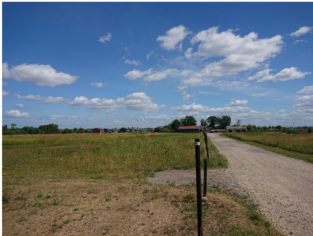
1.attēls. Skats uz detālplānojuma teritoriju no vietējas nozīmes valsts autoceļa V2